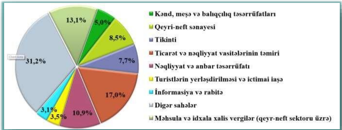
Qrafik 1. Qeyri-neft sektorunda yaradılmış əlavə dəyərin sahələr üzrə bölgüsü

2020-ci ilin yanvar-mart ayları ərzində qeyri-neft sektorunun artımına ən çox müsbət təsir qeyri-neft sənayesindən formalaşmışdır. Bununla yanaşı, qeyri-neft sektorunda ticarət və nəqliyyat vasitələrinin təmiri sahəsinin xüsusi çəkisi 17,0%, nəqliyyat və anbar təsərrüfatının 10,9%, qeyri-neft sənayesinin 8,5%, tikintinin 7,7%, kənd, meşə və balıqçılıq təsərrüfatlarının 5,0% olmuşdur.