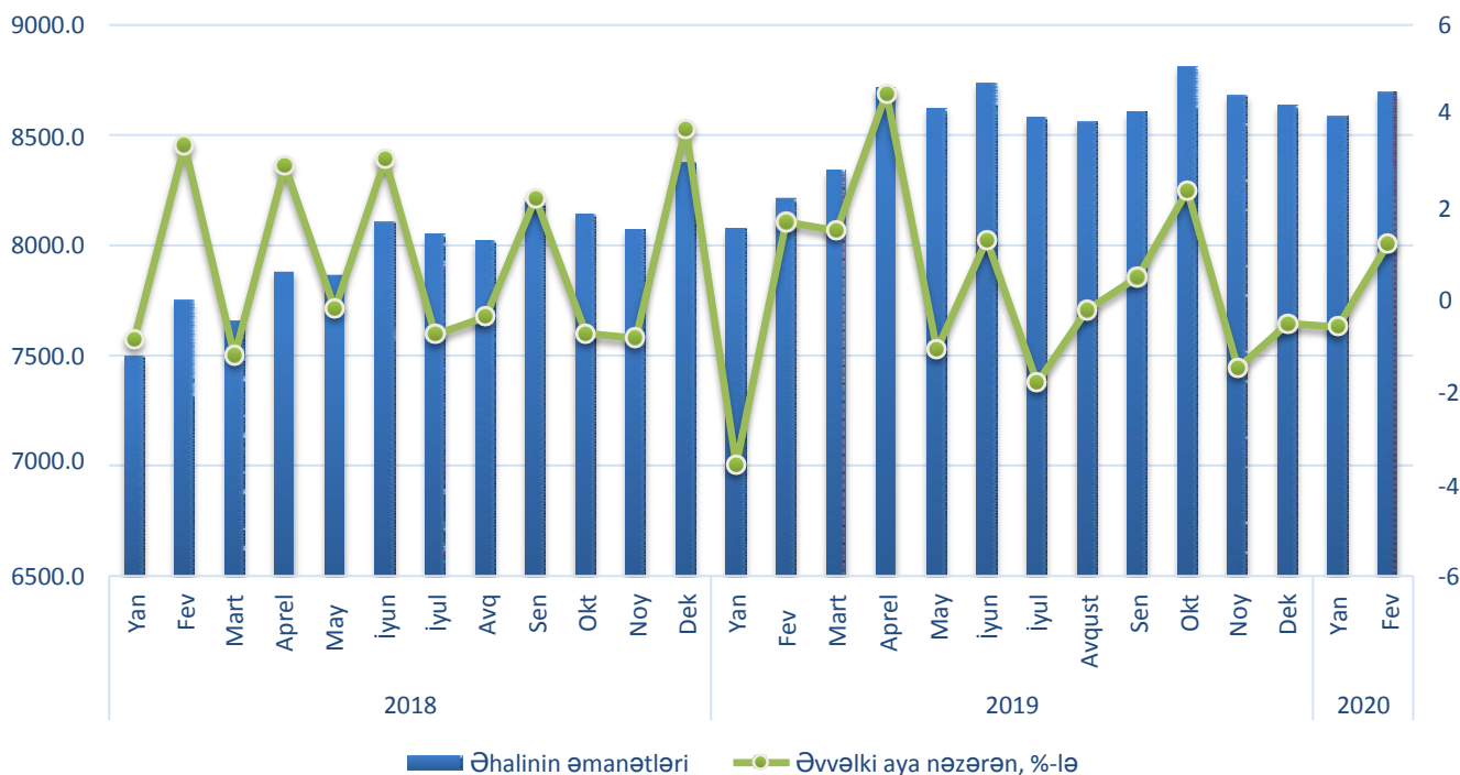
Qrafik 3. Əhalinin əmanətləri, dövrün sonuna, mln. AZN

2020-ci ilin 1 mart tarixinə cəmi depozitlər 2019-cu ilin müvafiq dövrü ilə müqayisədə 11.3%, milli valyutada olan depozitlər isə 25.3% artmışdır.